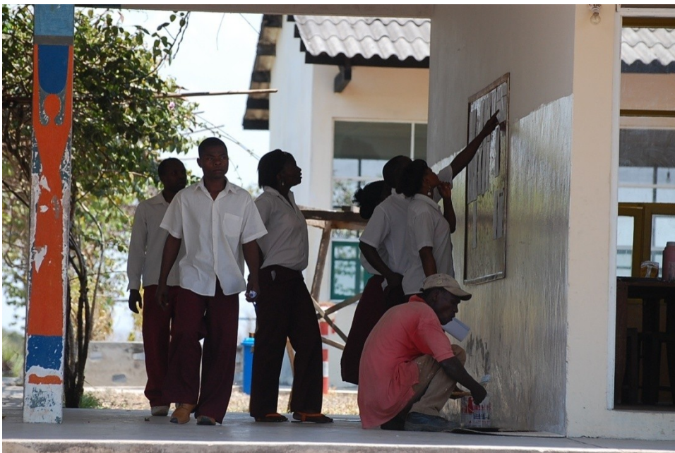
Esta foto ilustra imágenes de los alumnos en plenas actividades escolares

A pesar de tener muchas solicitudes por parte de los candidatos, la razón de haber priorizado la admisión de un mayor número de mujeres en relación con los hombres parte de la presuposición positiva de la promoción de la educación entre las muchachas, según las respuestas recogidas en las entrevistas realizadas.