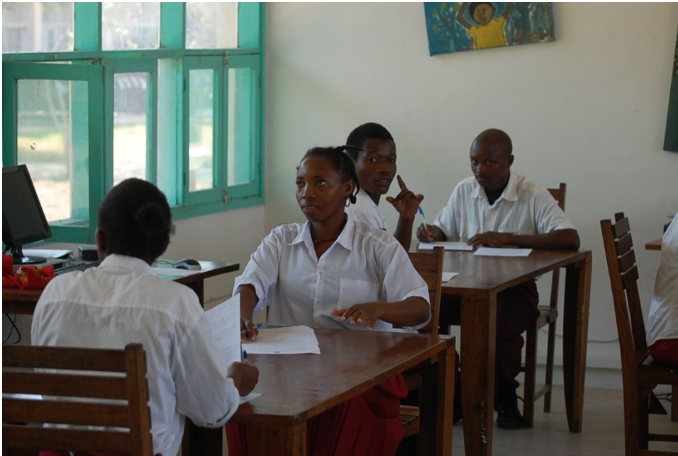
Esta foto ilustra imágenes de los alumnos en plena sala de clases