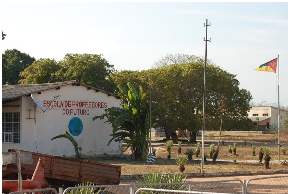
Imágenes de algunas instalaciones de la EPF de Bilibiza